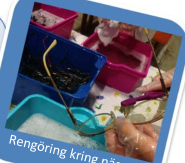
Rengöring kring näsan