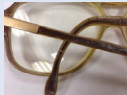
Trasiga delar eller lagningar