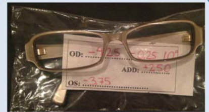
Bi- eller multifokala OD: -4,25 = -0,25 x 10° OS: -3,75 ADD: +2,50

Single-vision styrkor skrivs direkt på påsen med permanent, medium (M) spritpenna.