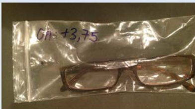
Single Vision, samma styrka OA: +3,75

Sfäriska ekvivalent: max 0,75 D. Cylinderstyrka: max 0,75 D.