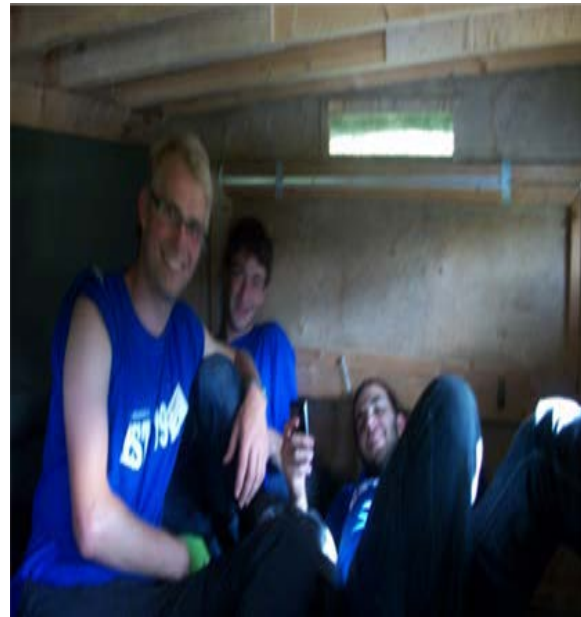
Här ses ett s.k. "Björngömsle" 6 m2 stort, takhöjd knappt 150cm. Fyra personer i taget Satt i gömslet fr kl 16.00 -kl 08 I väntan på att få se en björn