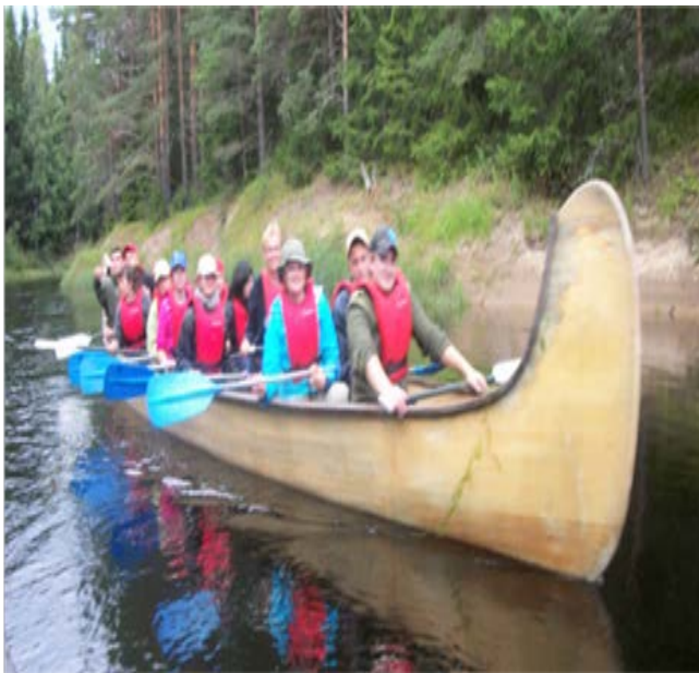
Bäversafari, några deltagare på väg