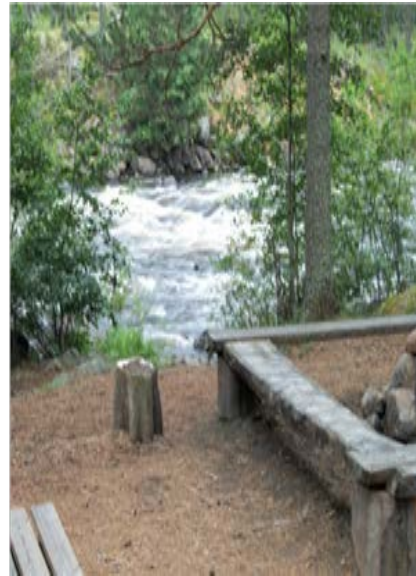
Lägerboende Måltidsplatsen o dess vackra vy över Voxnan